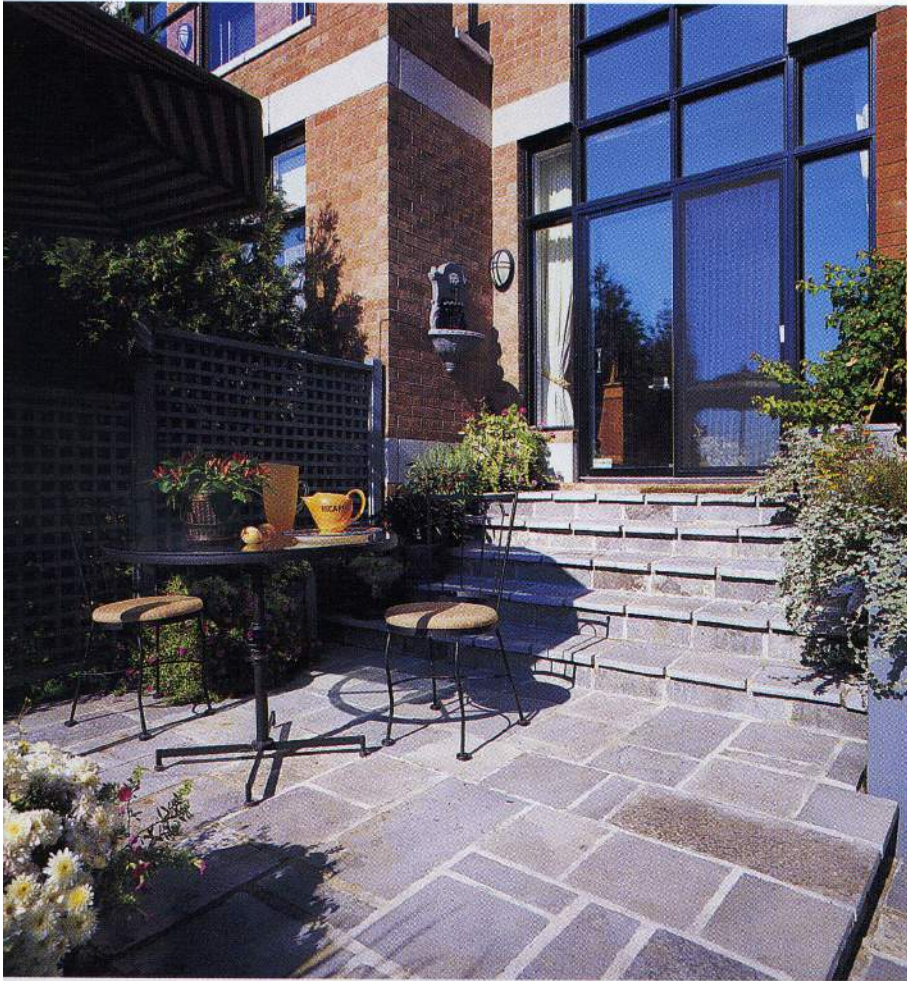
Sur le premier palier, le coin déjeuner et apéro s'appuie à un treillis teint en gris vert, parfaitement harmonisé à l'aménagement.

rafraîchissante à l'heure du midi et sert d'abri durant les soupers qui s'étirent tard dans la nuit. Les fleurs, les fines herbes et les vivaces qui foisonnent dans les bacs de l'aménagement adoucissent l'aspect rigide de la pierre. Des parfums flottent dans l'atmosphère et nous nous laissons bercer par le bruissement du jet du bassin qui luit tout à côté.