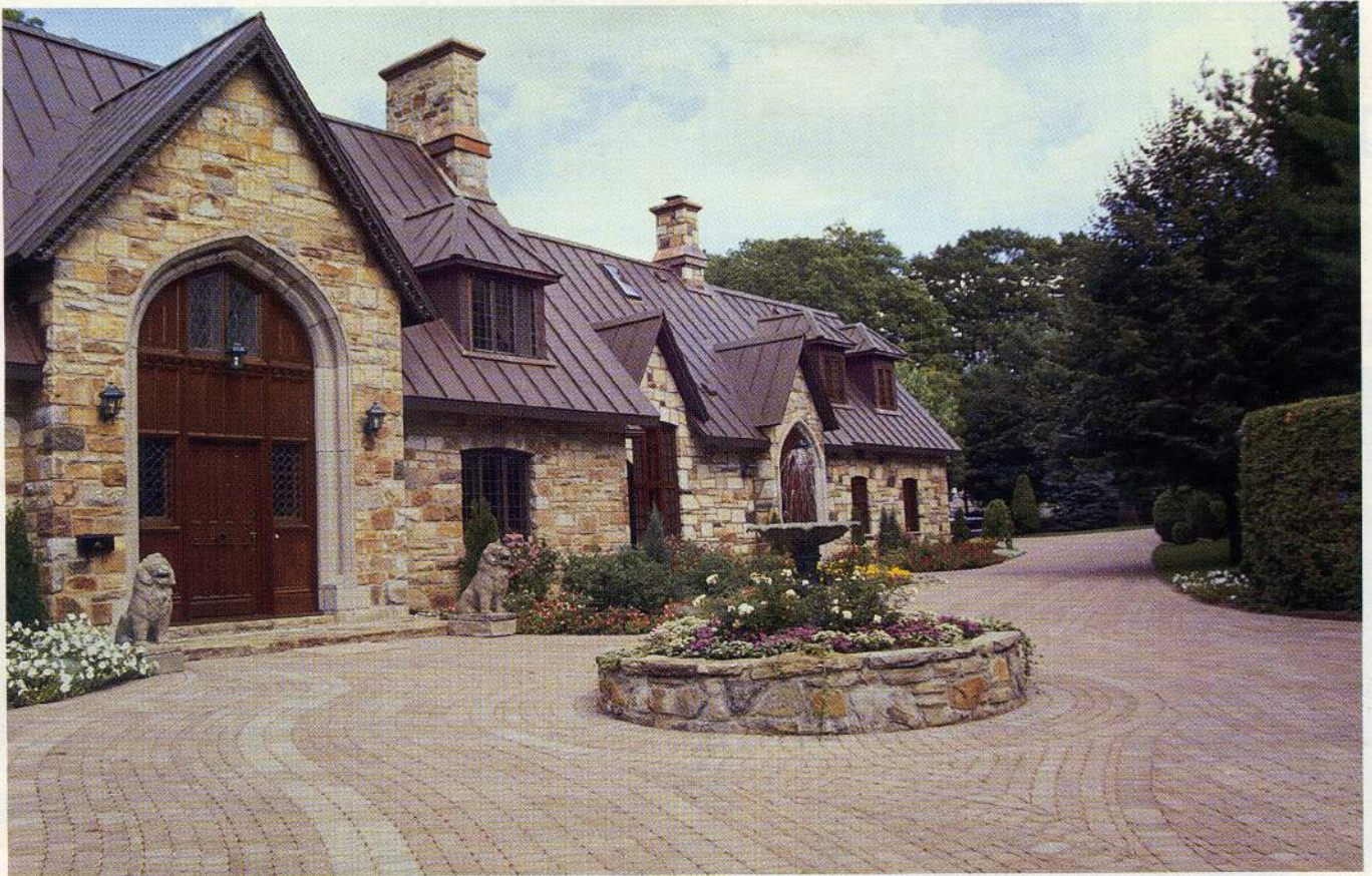
Ici, la fontaine, entourée de rosiers, d'agérates et de lierres, est ceinturée d'un pavé de béton dont l'agencement porte le regard vers l'entrée principale.

est ce qui vous permettra d'apprécier, d'aimer votre aménagement; c'est ce qui vous procurera une bonne partie de votre confort chez vous.