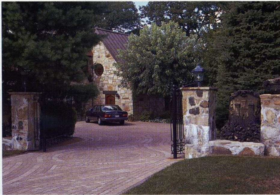
Les colonnes, le muret et les ornements s'harmonisent déjà avec la construction. On a retenu le pavé de béton de type «Classico». Le cercle souligne l'entrée.

Les voies de circulation bien localisées, on y dessine ensuite les aires de plantation. Dans vos massifs de végétaux, il y a tout lieu de mettre certains points d'intérêt tout au long du parcours. Une plante ayant un feuillage spécial, une forme, une écorce ou une floraison particulières, une urne ou encore une sculpture peuvent souligner gentiment le trajet à faire pour entrer chez vous. N'hésitez pas à utiliser les végé-